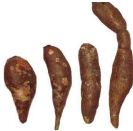
Hình 4. Minh họa hình dạng củ

Sự hình thành cuống củ: 0 = không cuống, 3 = có cuống và 5 = lẫn lộn.