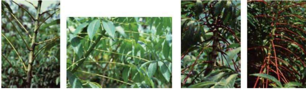
Hình 2. Minh họa 4 kiểu hình hướng cuống lá theo thứ tự từ trái sang phải

Hướng cuống lá: 1 = hướng lên trên, 3 = ngang, 5 = hướng xuống và 7 = không quy luật (Hình 2).