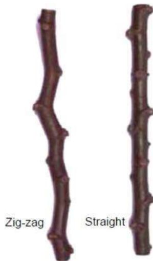
Hình 3. Minh họa kiểu hình thân thẳng và zig-zag

Dạng phát triển thân: 1 = thẳng và 2 = zig-zag (Hình 3).